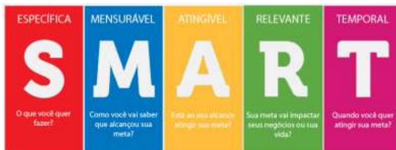
Fig.4 - SMART

Cada um desses critérios ajuda a tornar os objetivos mais objetivos e estruturados, permitindo maior foco e monitoramento ao longo do tempo. Um objetivo SMART deve ser bem definido, com métricas claras para avaliar o progresso, realista em termos de recursos e capacidades, relevante para o contexto da empresa ou projeto, e com um prazo estabelecido para sua conclusão. Ao aplicar o método SMART, equipes e indivíduos conseguem traçar metas mais eficientes e mensuráveis, o que aumenta as chances de sucesso.