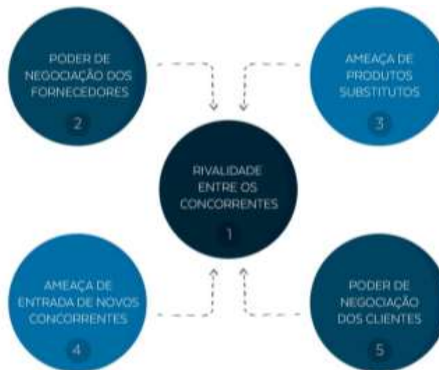
Fig.1 –As 5 forças de Porter.

Utilizada para um entendimento de cenário de concorrência, ameaças encontradas, e desafios de novos concorrentes entrantes no mercado educacional.